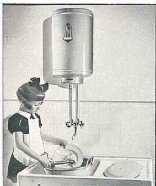
A midi et le soir pour le lavage de la vaisselle.