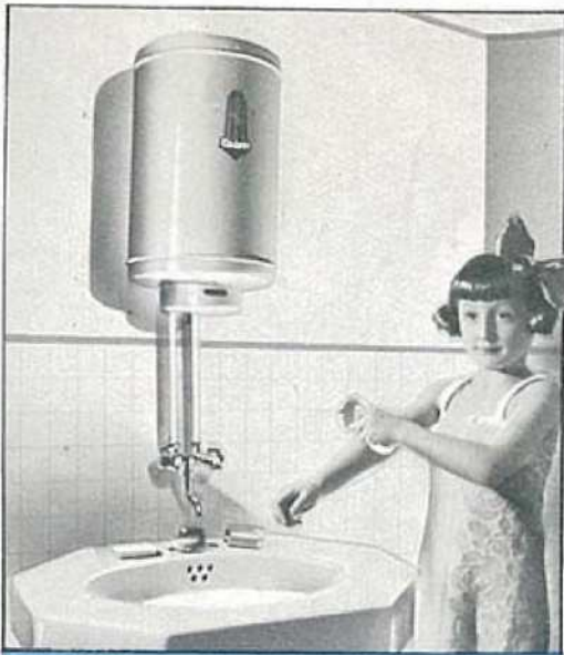
Le matin pour la toilette.