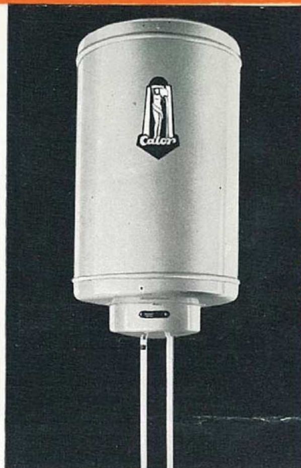
N° 710 10 litres