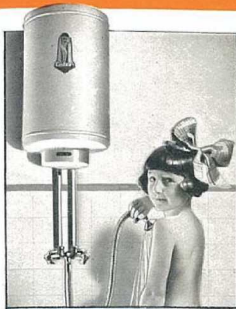
Pour la douche bienfaisante.

Il coupe et rétablit automatiquement le courant lorsque l'eau contenue dans l'appareil atteint la température pour laquelle il a été réglé.