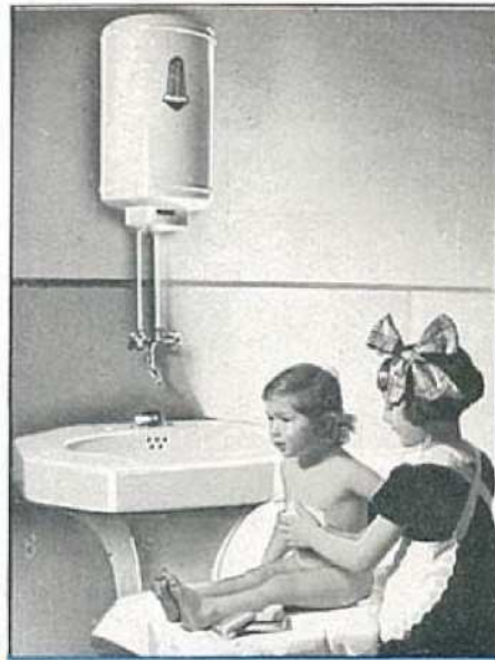
Pour le bain de Bébé.

Vous apprécierez les services de ce petit Chauffe-eau électrique qui par la simple manœuvre du robinet vous donnera instantanément de l'eau chaude.