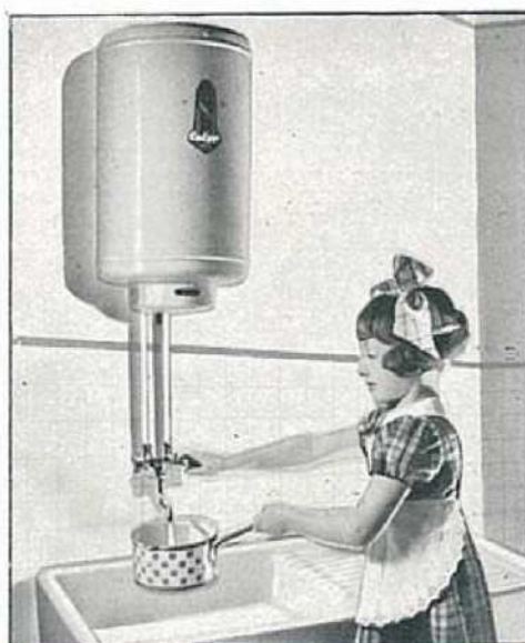
20 fois par jour pour les utilisations ménagères diverses.

Le chauffe-eau électrique "Calor" présente l'avantage précieux de fonctionner automatiquement. Le courant se coupe de lui-même à la seconde précise où il y aurait surchauffage et il se rétablit à l'instant où un complément de chaleur est nécessaire pour réchauffer l'eau de remplacement ou pour compenser la chaleur perdue durant les trop longues périodes de repos.