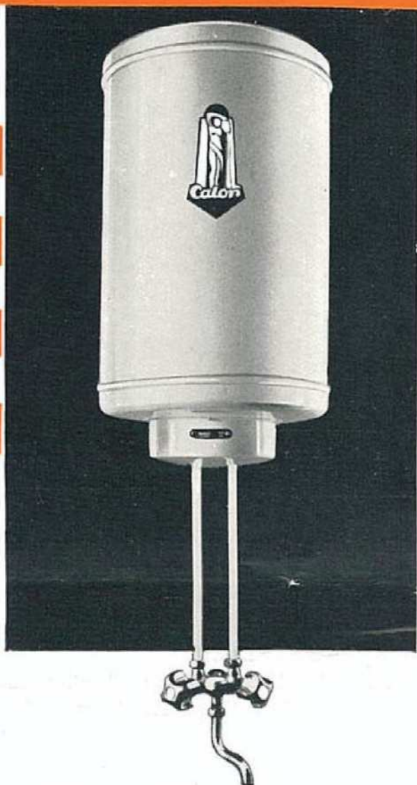
N° 711. — 10 litres à chauffage rapide.

N° 711. CHAUFFE-EAU 10 LITRES, 935 WATTS. — Il est équipé avec deux éléments chauffants, l'un d'une puissance de 135 watts pour assurer le chauffage normal en 8 heures, l'autre d'une puissance de 800 watts, additionnel, pour assurer le chauffage rapide à 90° en 1 heure. Ce dernier est commandé à la main par un bouton à poussoir. Chaque élément est connecté à un thermostat spécial. Les deux thermostats, si les deux éléments sont en circuit, couperont le courant lorsque la température de l'eau atteindra 90° environ, mais seul le thermostat de chauffage normal réenclenchera de lui-même au refroidissement. Le fonctionnement du chauffage rapide est donc facultatif. Voulez-vous rapidement de l'eau chaude, alors que celle contenue dans le réservoir, à la suite de nombreux soutirages, est froide ou tiède ? Enclenchez le chauffage rapide en poussant sur le bouton-poussoir. Un voyant rouge apparaît indiquant que l'élément de chauffage rapide est en circuit.