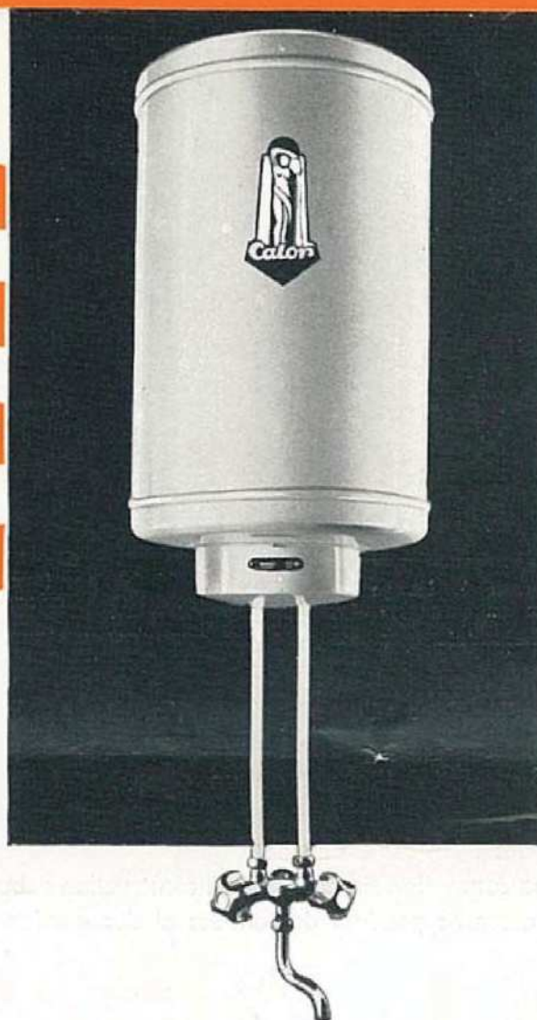
N° 711. — 10 litres à chauffage rapide.

N° 711. CHAUFFE-EAU 10 LITRES, 935 WATTS. — Il est équipé avec deux éléments chauffants, l'un d'une puissance de 135 watts pour assurer le chauffage normal en 8 heures, l'autre d'une puissance de 800 watts, additionnel, pour assurer le chauffage rapide à 90° en 1 heure. Ce dernier est commandé à la main par un bouton à poussoir. Chaque élément est connecté à un thermostat spécial. Les deux thermostats, si les deux éléments sont en circuit, couperont le courant lorsque la température de l'eau atteindra 90° environ, mais seul le thermostat de chauffage normal réenclenchera de lui-même au refroidissement. Le fonctionnement du chauffage rapide est donc facultatif. Voulez-vous rapidement de l'eau chaude, alors que celle contenue dans le réservoir, à la suite de nombreux soutirages, est froide ou tiède ? Enclenchez le chauffage rapide en poussant sur le bouton-poussoir. Un voyant rouge apparaît indiquant que l'élément de chauffage rapide est en circuit.