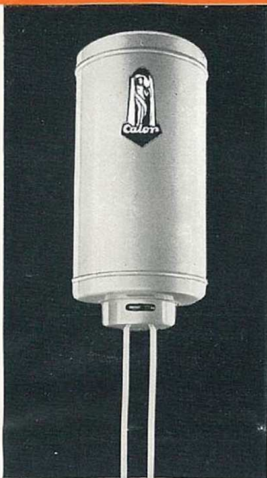
N° 712 5 litres